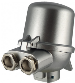
DOPPEL - VARIANTE