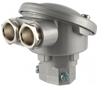
DOPPEL - VARIANTE