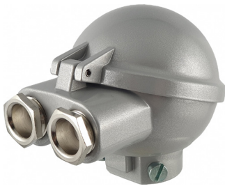
DOPPEL - VARIANTE